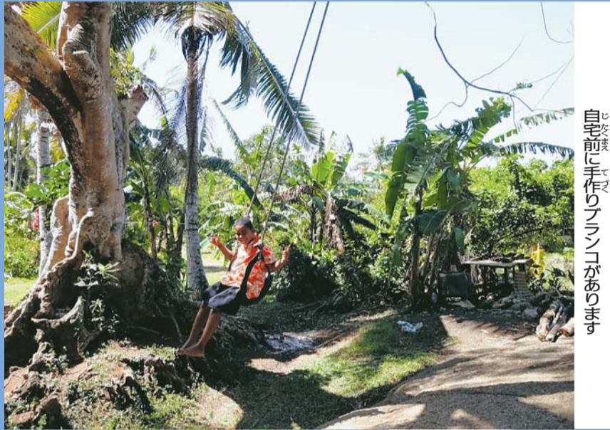
自宅前に手作りのブランコがあります

歌うこと。毎週日曜日は教会で賛美歌を歌うし、お母さんはシンガーなので、僕にとって歌うことは家族との絆のようなものです。