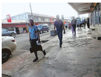
お弁当を手に通勤する人々

手で食べるともっとおいしい そしてランチの時間!きれいに手を洗った後はみんな上手に手を使って食べます。日本では手で食べるとお行儀が悪いと怒られてしまいましたが、フィジーでは「手を使って食べると、食べ物がいよいよおいしくなるんだよ」なんて言われます。日本を飛び出してみると面白い発見がありました。