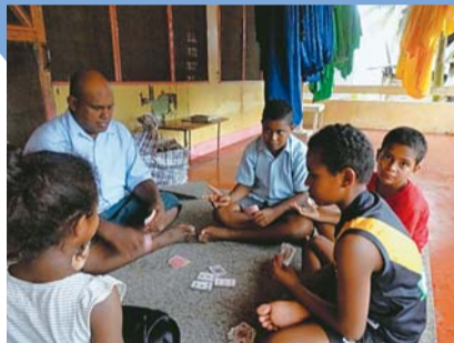
雨の午後は庭先でトランプ

フィジーではラグビーが国民的スポーツ。大人も子どもも大好きです。僕も学校のラグビーチームでいつも練習しているよ。雨で外に出られない時はトランプゲームに夢中。