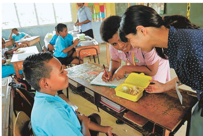
お弁当チェックの様子

朝の出勤時間、ぶらぶらと歩きながらオフィスに向かう途中では、たくさんの人と出会います。たとえ知らない人でも「おはよう! 今日はいい天気だね!」「良い一日を!」「あなたもね」と、短い会話をしながらすれ違う朝の時間が私はとても好きです。 見ると多くの人が新聞紙やビニール袋で包んだ何かを手に入れています。中身はお弁当です。フィジーの小学校には給食がないので、子どもたちも家からお弁当を持って学校へ行きます。 私は栄養士として小学校を訪ね、子どもたちのお弁当の栄養バランスについてお話ししたりしています。「今日のお弁当はなんですか?」と一人一人に質問すると、みんな恥ずかしそうにはにかみながら答えてくれるところがとても可愛く思います。入れ物もまた、アイスクリームの空き箱だったり、ビニールで包んであったりとさまざまです。